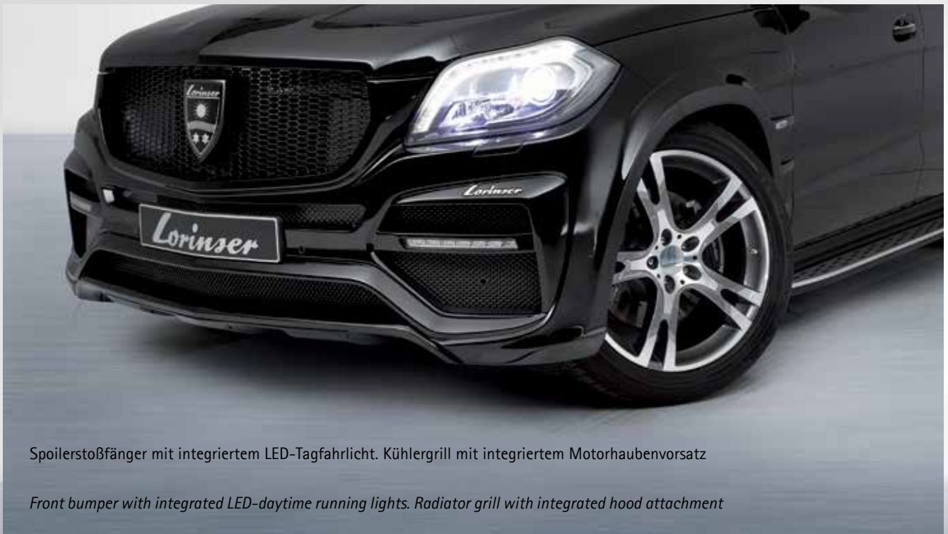
Spoilerstoßfänger mit integriertem LED-Tagfahrlicht. Kühlergrill mit integriertem Motorhaubenvorsatz

It's not a car. It's a phenomenon. The GL-Class achieves through the Lorinser bodykit an exceptional visual presence. Another eye-catcher is the front fender with its distinctive optical air intakes. The vehicle front is refined by the Lorinser front bumper with integrated LED-daytime running lights. The sports exhaust system with chromed tailpipes produces a sonorous sound. A specially developed sports lowering module brings the vehicle closer to the road. Lorinser is also open to all kinds of interior requests.