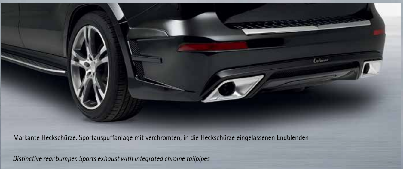
Markante Heckschürze. Sportauspuffanlage mit verchromten, in die Heckschürze eingelassenen Endblenden

Front bumper with integrated LED-daytime running lights. Radiator grill with integrated hood attachment