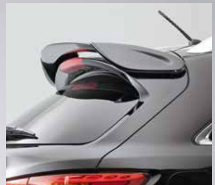
Formschöner Dachspoiler. Well-designed roof wing.