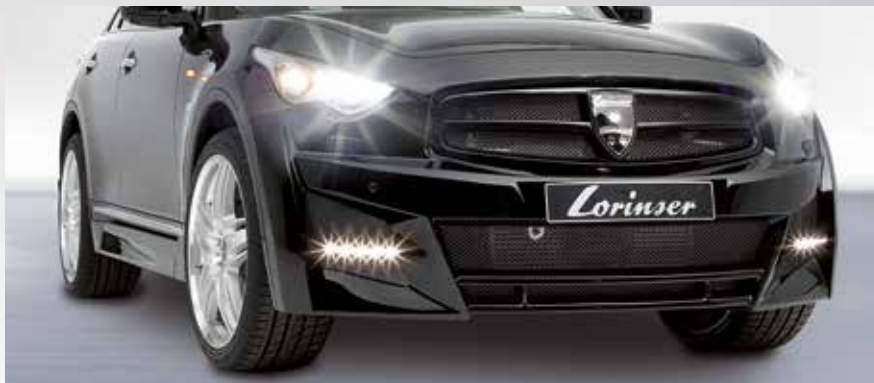
Spoilerstoßfänger mit eingebetteten LED-Tagfahrlichtern. Front bumper with embedded LED-daytime running lights.