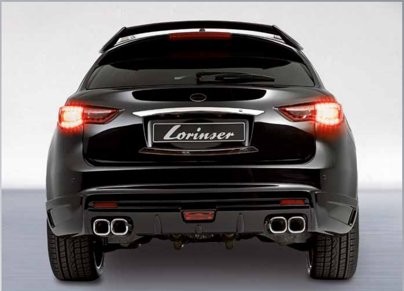
Markante Heckschürze. Perfekt integrierte Auspuffblende.