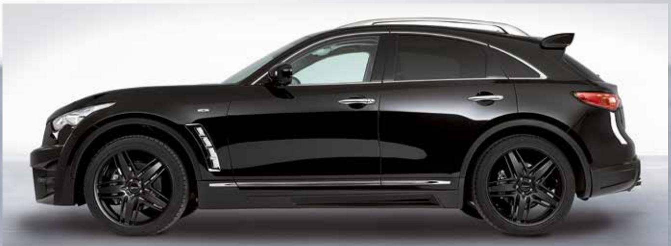
Heruntergezogene Seitenschweller für eine harmonische Verbindung von Front und Heck. Drawn-down side skirts for an harmonious relation between front and rear.