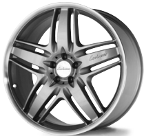
Einteiliges Leichtmetallrad poliert one-piece rim polished