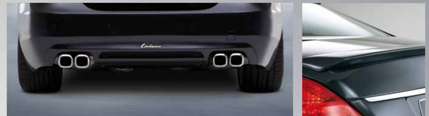
Sportliche Heckpartie mit Lorinser Heckschürze, Sportauspuff mit zwei rechteckigen Doppel-Endrohren und einer harmonisch designten Heckklappe.