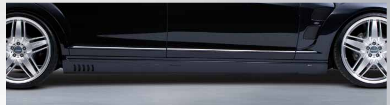
Markante Seitenschweller mit Lorinser-typischen Kiemen als Bindeglied zwischen Front und Heck.