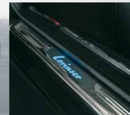
Beleuchtete Türeinstiegsleisten mit Lorinser-Schriftzug. Illuminated doorsill panels with Lorinser logo.