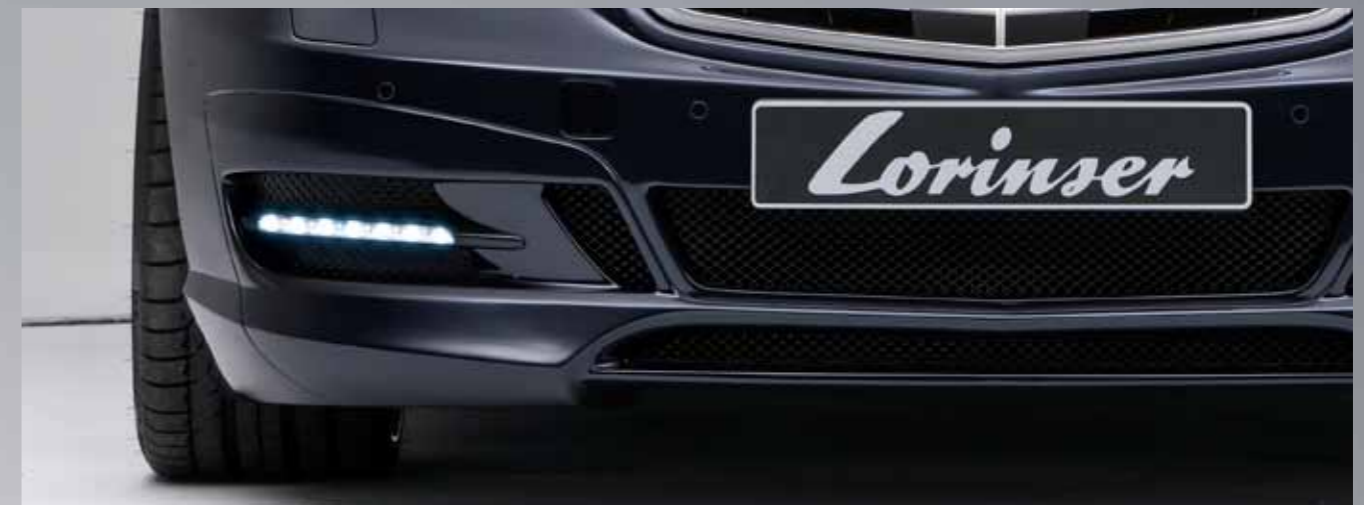
Frisches Frontdesign mit dominantem Spoiler-Stoßfänger und integrierten LED-Tagfahrlichtern.