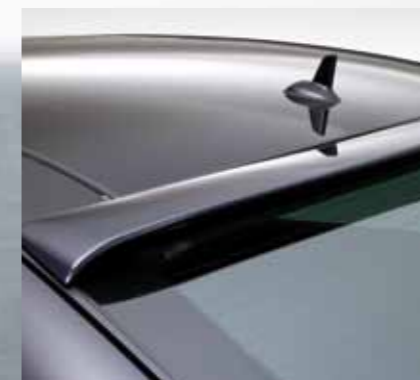
Dynamischer Dachspoiler. Dynamic roof spoiler.